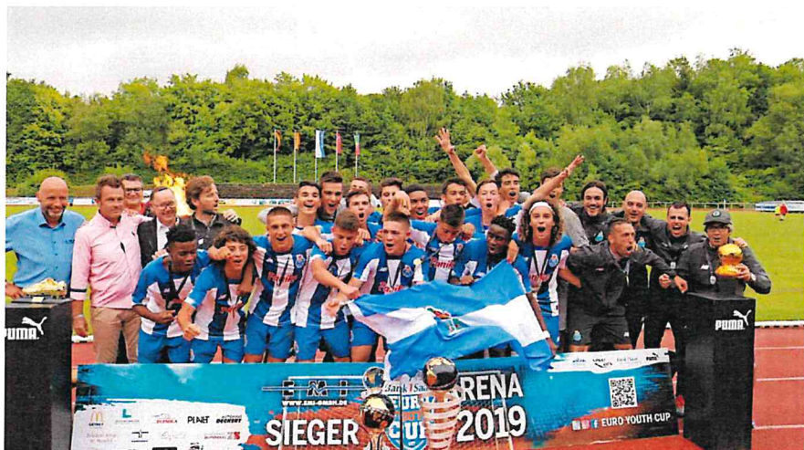
Im vergangenen Jahr feierte der FC Porto den Sieg beim Euro-Youth-Cups in St. Wendel.

27. August 2020 um 14:57 Uhr | Lesedauer: 4 Minuten